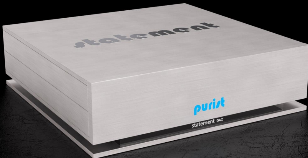
Frontansicht mit Glasboden und optionaler Base

NATIVE PCM Digital-Analog- & Analog-Digital-Converter UVP 2024